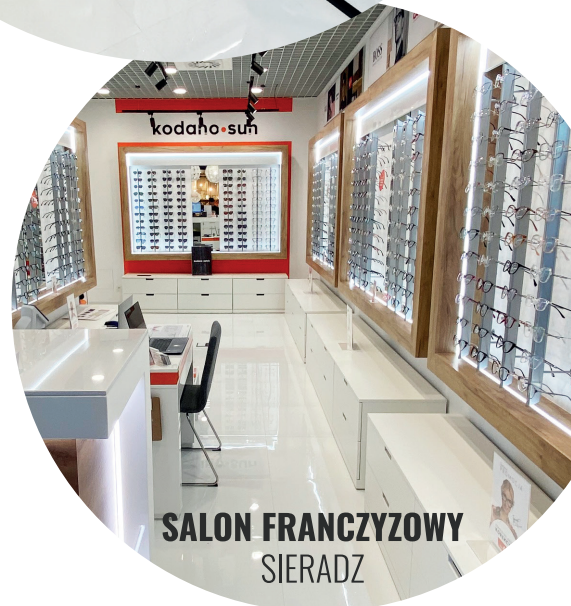
SALON FRANCZYZOWY SIERADZ