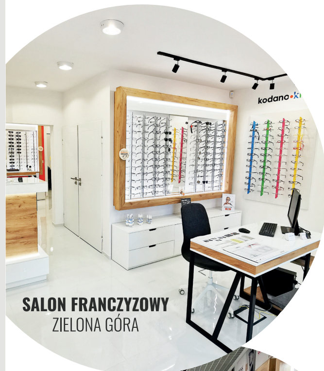
SALON FRANCZYZOWY ZIELONA GÓRA